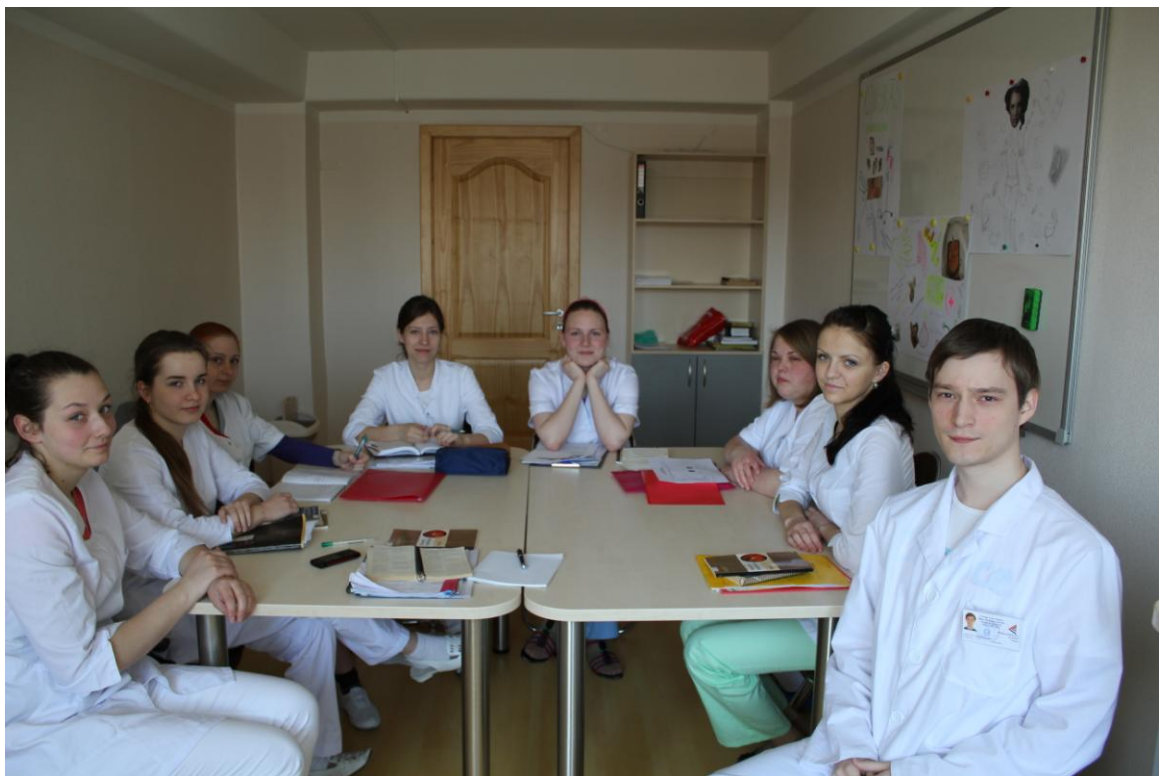
Ārstniecības programmas studenti klīnisko manipulāciju auditorijā

Latvijas Universitātes Rīgas Medicīnas koledžas īstenotā projekta „Latvijas Universitātes Rīgas Medicīnas koledžas infrastruktūras modernizēšana veselības aprūpes studiju programmās” ietvaros koledžas ēkā Hipokrāta ielā 1, Rīgā, izveidotas un iekārtotas klīnisko procedūru laboratorija un neatliekamās palīdzības laboratorija. Tajās studenti apgūst praktiskās zināšanas studiju programmās „Māszinības” un „Ārstniecība”.