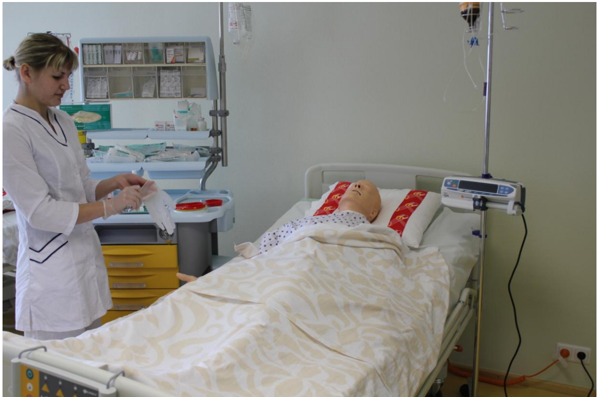
Klīnisko manipulāciju laboratorija – sagatavošanās injekcijas veikšanai