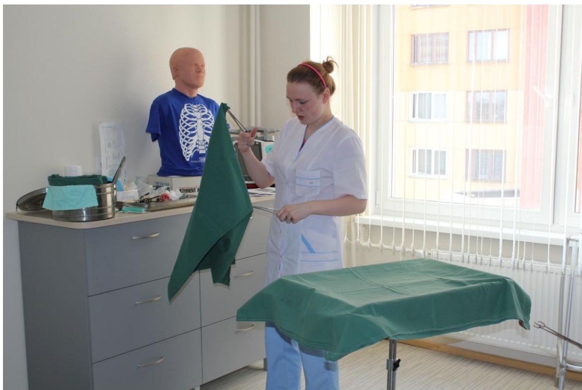
Neatliekamās palīdzības laboratorija - sterila galdiņa klāšana