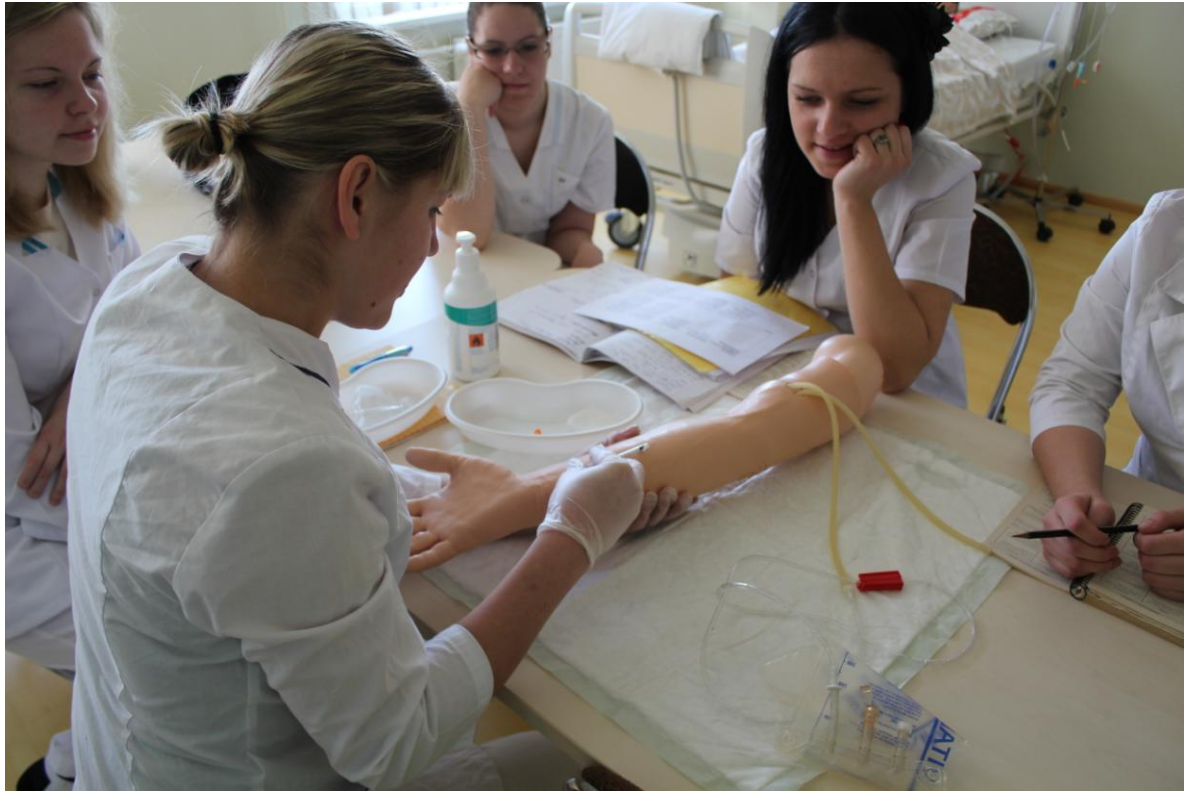
Klīnisko manipulāciju laboratorija – subkutānas injekcijas veikšanas treniņš, Māszinību studiju 1. kurss